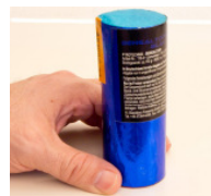
XXL Bengaltopf Blau

Intensives Bengalfeuer in Blau, ca. 65 sec Laufzeit. Flammenhöhe ca. 50-60 cm