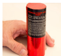
XXL Bengaltopf Rot

Intensives Bengalfeuer in Rot, ca. 65 sec Laufzeit. Flammenhöhe ca. 50-60 cm